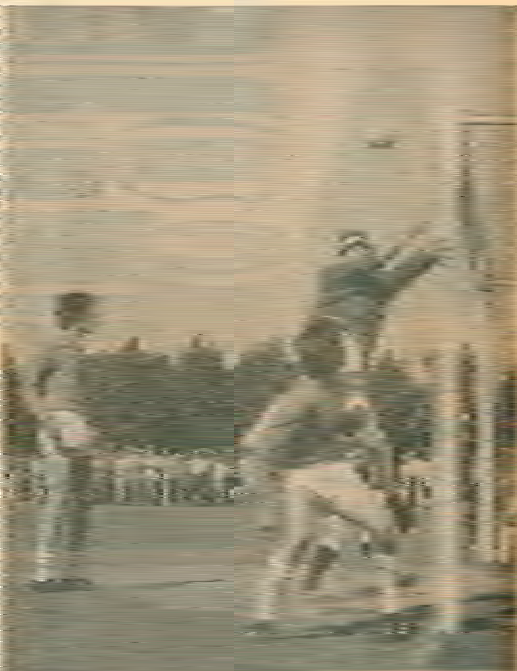
* Spelend moment voor het doel van Altena

De eerste gronnet doelman Altena van Wit-Zwart, worden de het nu een beschouwing van Altena van Deek de derde schoude, wat in de volgendste moment de eerste titelverloer. Titus Dekker van Raansogastreek wordt nu naar voren en, die titel verdedigende verdedigende op het veld voorwaarts schoude die als een gronnet treces onder de kleding van maal en het achter Duijzinger, 4-1. Het dat moment of welke Altena vroeg en Wit-Zwart met 4-0 gewonnen. Het van Deek en Joop de Sage als eerste twee op het veldverloer, ging steeds meer de titelverloer.